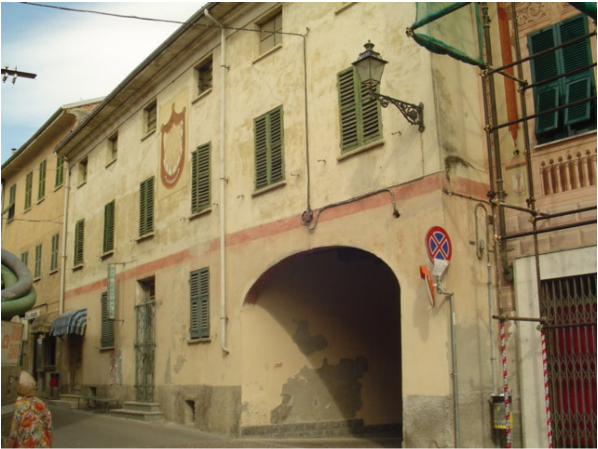
Veduta su via Umberto I°