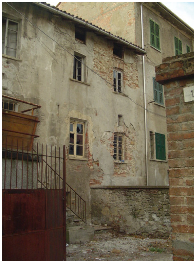
Veduta su interno cortile