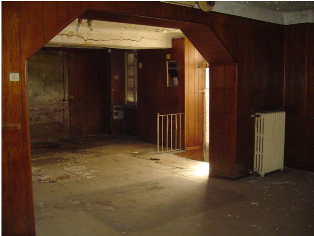
Veduta interna piano terra