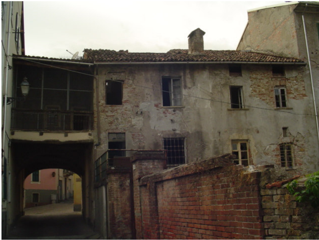
Veduta su corte interna e passaggio carraio