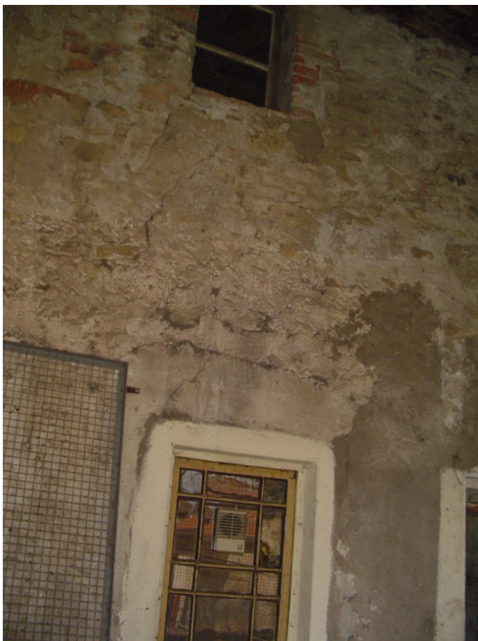
Parete terrazzo piano primo