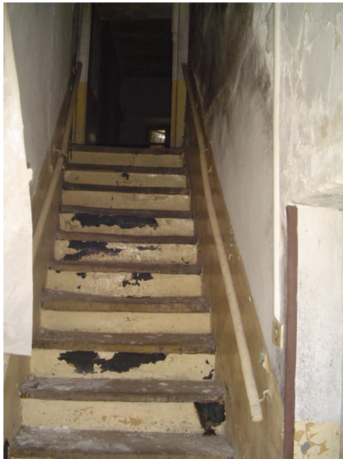
Scala di collegamento tra piano terra e piano primo