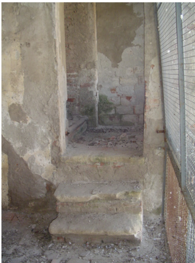
Veduta da terrazzo piano primo a interno fabbricato