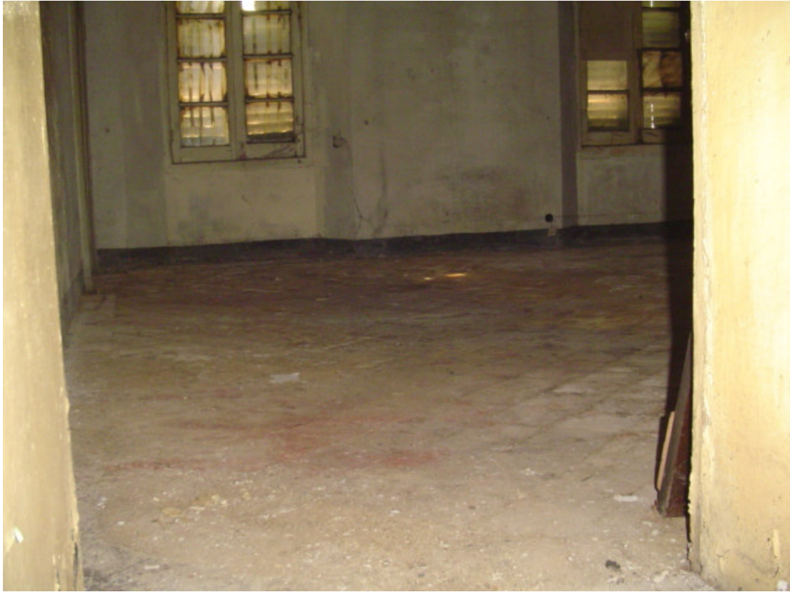
Veduta interna piano primo